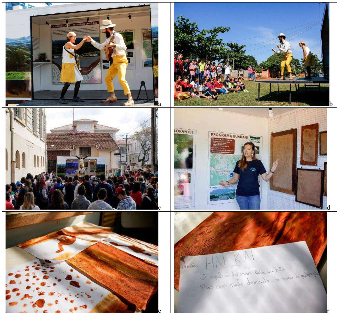
Figura 5. Registro fotográfico de atividades artísticas e oficinas realizadas em Botucatu: peça de teatro (a, b e c); material educativo da parte interna do trailer, sendo trabalhado por professora (d); oficina de pintura com terras (e) e oficina literária com Hai-Kai (f)

O Projeto foi apresentado em muitas escolas de Botucatu e já atingiu cerca de 5.000 alunos do ensino fundamental e médio, levando o conhecimento da geologia e a importância da preservação do patrimônio geológico da região, as Cuestas Basálticas. O Projeto tem como esteio a possibilidade de deslocamento de um “museu”, que facilitando sua visibilidade, tornando a informação democrática e levando o conhecimento científico para fora dos muros da Academia.