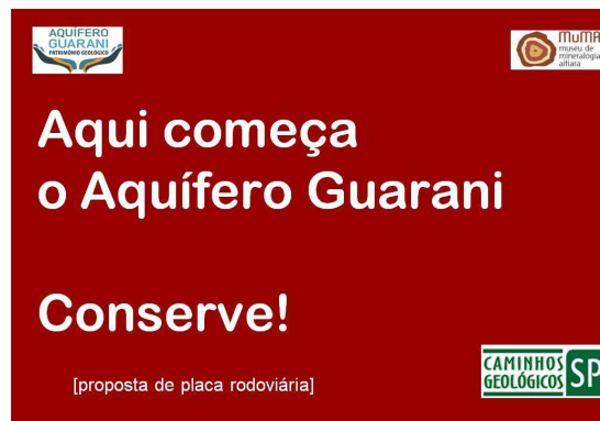
Figura 3. Exemplo de placa de indicação a ser instalada à margem da Rod. Castelo Branco

Uma página na web será organizada para abrigar o conjunto de informações e descrições. As placas físicas, contudo, constituem o principal volume de atividades, aproveitando-se exemplos do DRM/RJ, da Mineropar e do Instituto Geológico/SMA. Os trabalhos são apoiados em visitas de campo, aquisição de fotografias das unidades geológicas, produção de réplicas de feições notáveis das rochas do paleodeserto (Fig. 4) e uma descrição pormenorizada dos fatores e ações humanas capazes de ameaçar a qualidade das águas do aquífero.